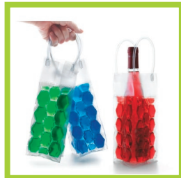
Página 19 - Ref. 802