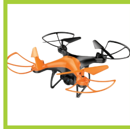
Página 22 - Ref. 866