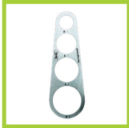
Página 6 - Ref. 801