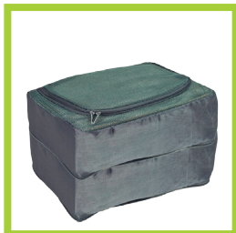
Página 19 - Ref. 856