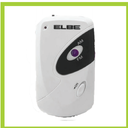
Página 14 - Ref. 836