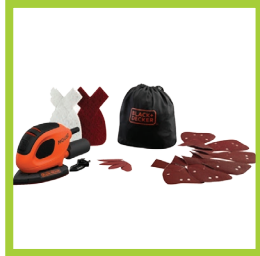
Página 22 - Ref. 865