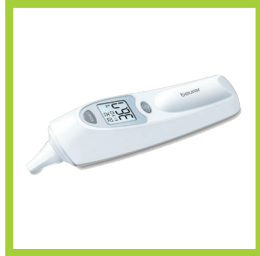
Página 11 - Ref. 825