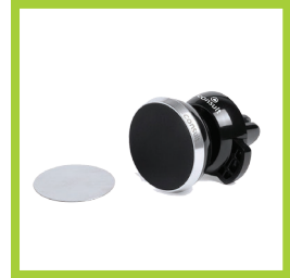
Página 23 - Ref. 867