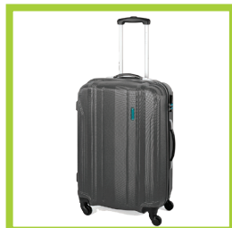
Página 21 - Ref. 861