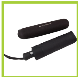
Página 14 - Ref. 837