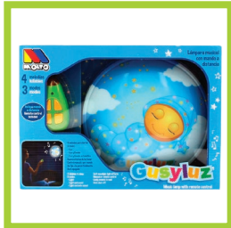
Página 17 - Ref. 848