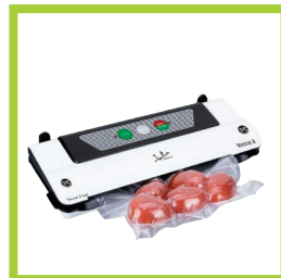
Página 9 - Ref. 817