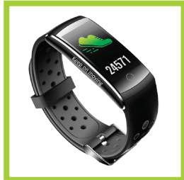
Página 24 - Ref. 873