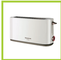
Página 8 - Ref. 812