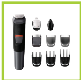
Página 15 - Ref. 841