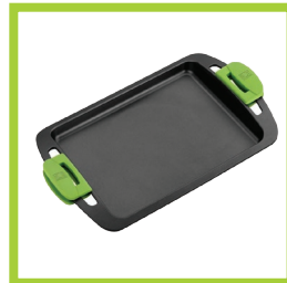
Página 8 - Ref. 813