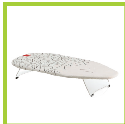
Página 10 - Ref. 821