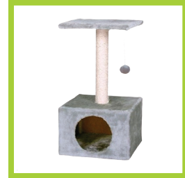
Página 12 - Ref. 827