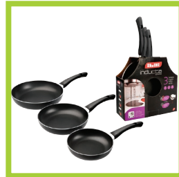
Página 7 - Ref. 809