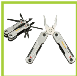
Página 20 - Ref. 860