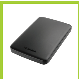
Página 25 - Ref. 876