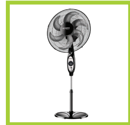
Página 13 - Ref. 831