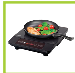
Página 21 - Ref. 863