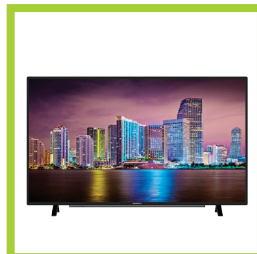
Página 26 - Ref. 878