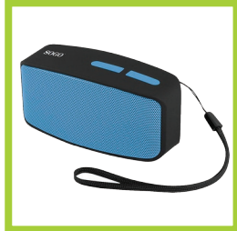
Página 23 - Ref. 869