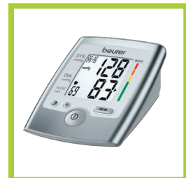
Página 16 - Ref. 843