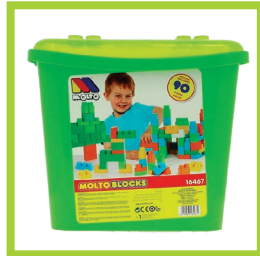
Página 17 - Ref. 849