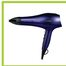
Página 15 - Ref. 838