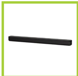
Página 26 - Ref. 877