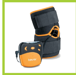
Página 16 - Ref. 846