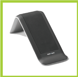
Página 24 - Ref. 872