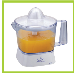
Página 7 - Ref. 807