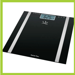
Página 11 - Ref. 823