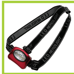
Página 14 - Ref. 834