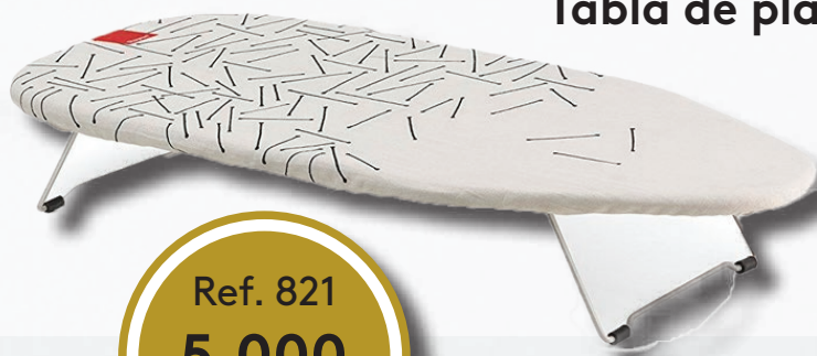
Tabla de planchar sobremesa Rayen

Plegable con funda muletón y percha para colgar. Medidas: 73,5 x 31,5 cm.