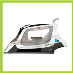
Página 12 - Ref. 828