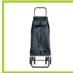
Página 13 - Ref. 830