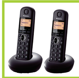
Página 25 - Ref. 874