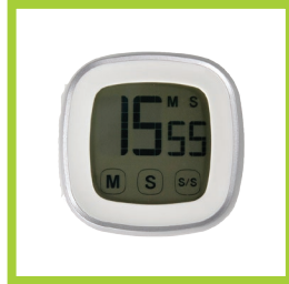
Página 6 - Ref. 803