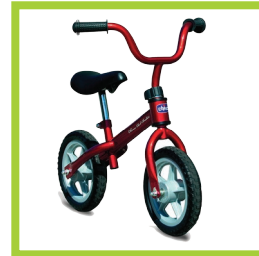
Página 18 - Ref. 851