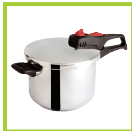
Página 9 - Ref. 816