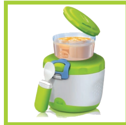
Página 18 - Ref. 850