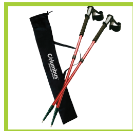
Página 20 - Ref. 858