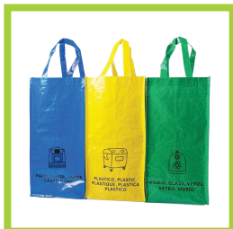
Página 10 - Ref. 819