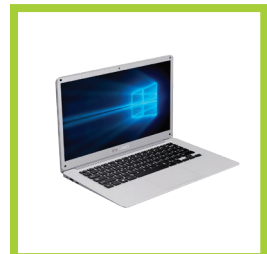
Página 26 - Ref. 879