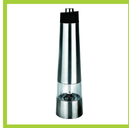
Página 6 - Ref. 804