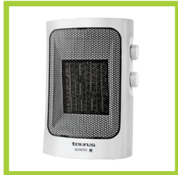
Página 12 - Ref. 829