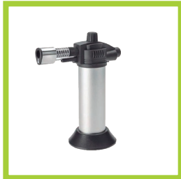
Página 7 - Ref. 806