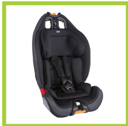
Página 18 - Ref. 852