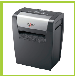
Página 13 - Ref. 832