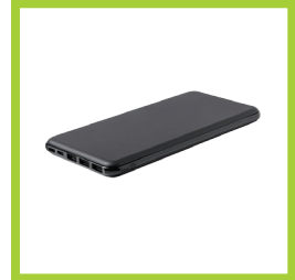
Página 24 - Ref. 871