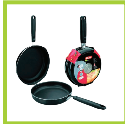
Página 7 - Ref. 808