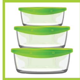
Página 6 - Ref. 805