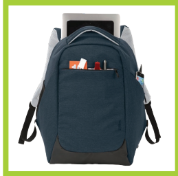
Página 16 - Ref. 844