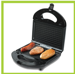
Página 8 - Ref. 810