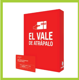
Página 22 - Ref. 864