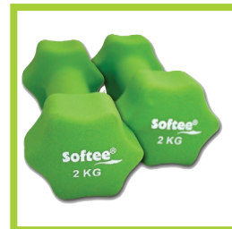
Página 20 - Ref. 859