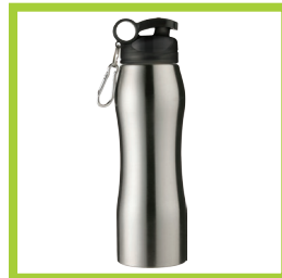
Página 19 - Ref. 853