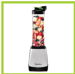
Página 9 - Ref. 814