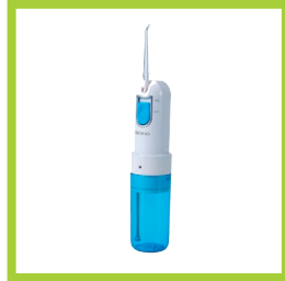
Página 16 - Ref. 845