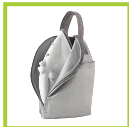
Página 10 - Ref. 820