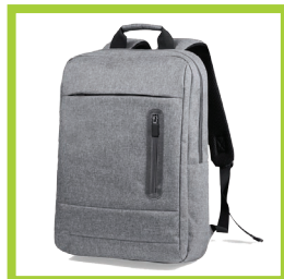
Página 20 - Ref. 857