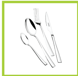
Página 8 - Ref. 811