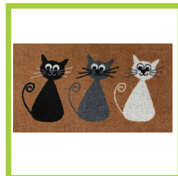
Página 10 - Ref. 822