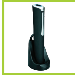
Página 11 - Ref. 826