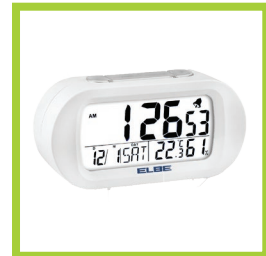
Página 14 - Ref. 835