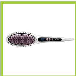
Página 15 - Ref. 840