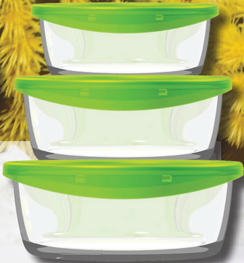
Set 3 recipientes vidrio Luminarc* Con tapa de plástico, válidos para congelación y microondas (retirando la tapa). Apto para lavavajillas. Medidas: 42, 67 y 92 cl.