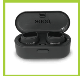
Página 25 - Ref. 875