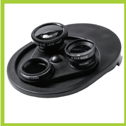
Página 23 - Ref. 868