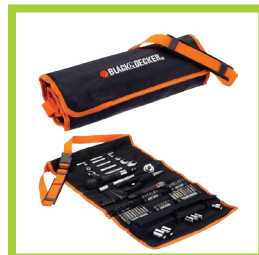
Página 21 - Ref. 862