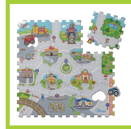
Página 17 - Ref. 847