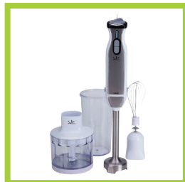
Página 9 - Ref. 815