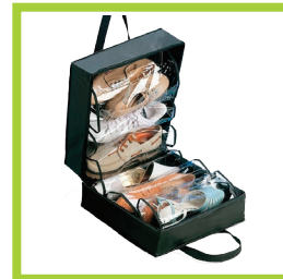
Página 19 - Ref. 855