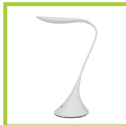
Página 15 - Ref. 842