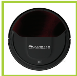
Página 13 - Ref. 833