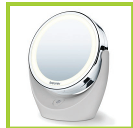
Página 15 - Ref. 839