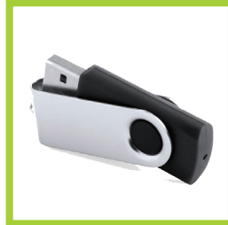
Página 24 - Ref. 870